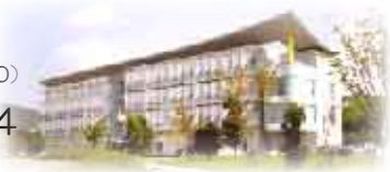
アネックス・テクノ2