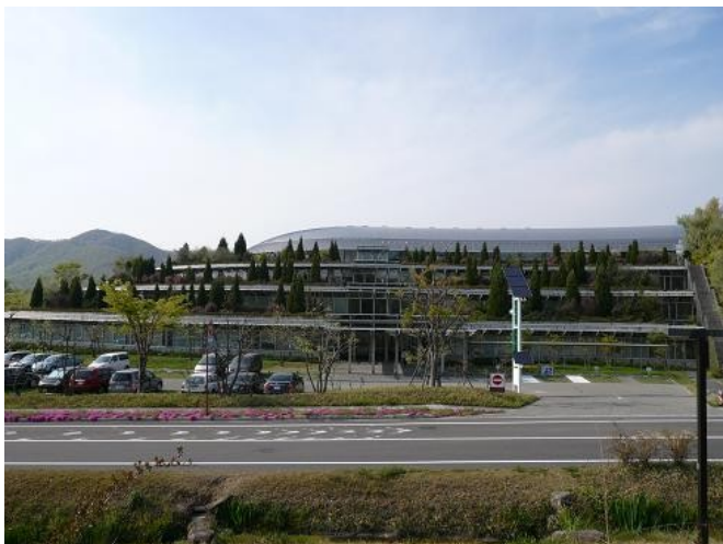
株式会社バイ・アール・テクノセンター外観